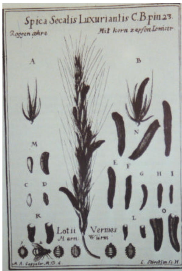
Abb. 1: Roggenähre mit Mutterkorn. Stich aus: Carl Nicolaus LANG: Descriptio morborum ex usu clavorum secalinarum Campaniae, Luzern 1717

Was es mit dem Namen ‚Mutterkorn‘ auf sich hat, ist nicht ganz klar. Nach vorherrschender Ansicht bezieht er sich auf seine Anwendung als Pharmakon in der Geburtshilfe. 8 Eine andere Theorie sieht demgegenüber den Ursprung des Namens in der Mythologie und führt ihn auf die Bezeichnung von Korndämonen wie Kornmutter, Roggenmuhme zurück. 9